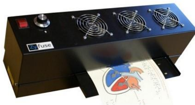
برجسته ساز حرارتی Zy-Fuse